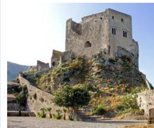
Il castello di Scaletta Zanclea